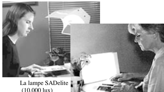
La lampe SAdelite (10,000 lux)

Luminothérapie - La luminothérapie ou traitement par la lumière intense est un moyen simple, médicalement reconnu et efficace pour lutter contre la dépression saisonnière. Des lampes spéciales sont utilisées pour le traitement : luminosité intense - absence de rayonnement ultraviolet.